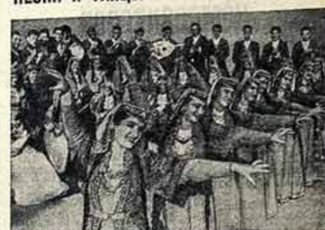
С этим ансамблем восковая лепка-коллаж еще десять лет назад, во время декады армянского искусства...