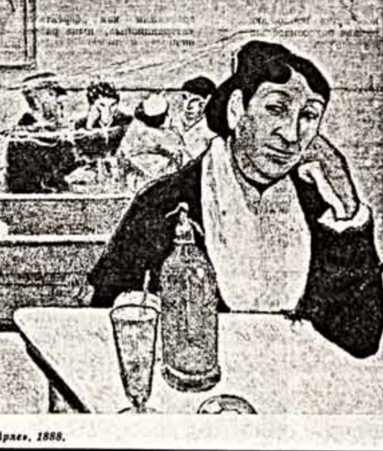
П. ГОГЕН. «Кафе в Арле», 1888.