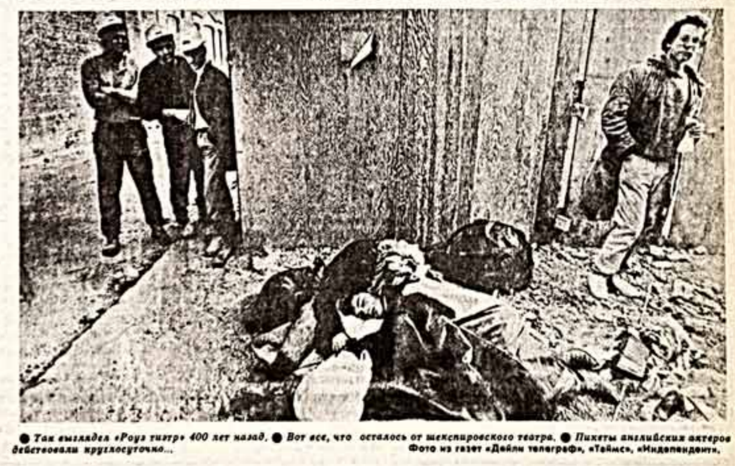
Так выглядел «Роуз театр» 400 лет назад. Вот все, что осталось от шекспировского театра. Пикеты английских актеров действовали круглосуточно.