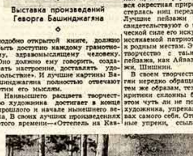
Г. Башинджаган. «Длинная дорога».

В Государственном музее южных культур в Москве открыта выставка произведений Георга Башинджагяна. Выставка произведений Георга Башинджагяна. Выставка произведений Георга Башинджагяна.