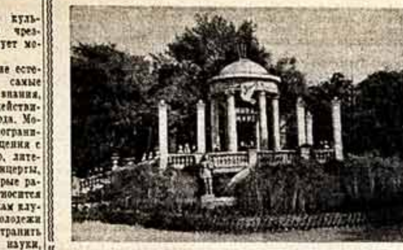
Один из живописных уголков ростовского городского сада имени Первого мая.

Много нового и приятного увидят жители Ростова летом в своем саду. На клумбах, газонах высажены новые сорта цветов, кустарников, деревьев. Это новое в нашем саду, это новое в нашем саду.