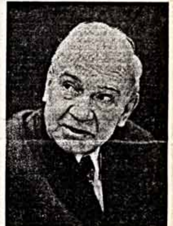
Б. ЛЬВОВ-АНОХИН. ● Народный артист СССР М. Царев.

И, наконец, еще одна традиция старейшего русского театра — крупнейшие актеры Малого театра, чувствуя ответственность за его судьбу, в зрелые годы становились его руководителями. Щепкин и Самарин были неофициальными, но фактическими руководителями труппы. Ленский — главным режиссером. Южин многие годы — бессменный директор. Царев также многие годы являлся