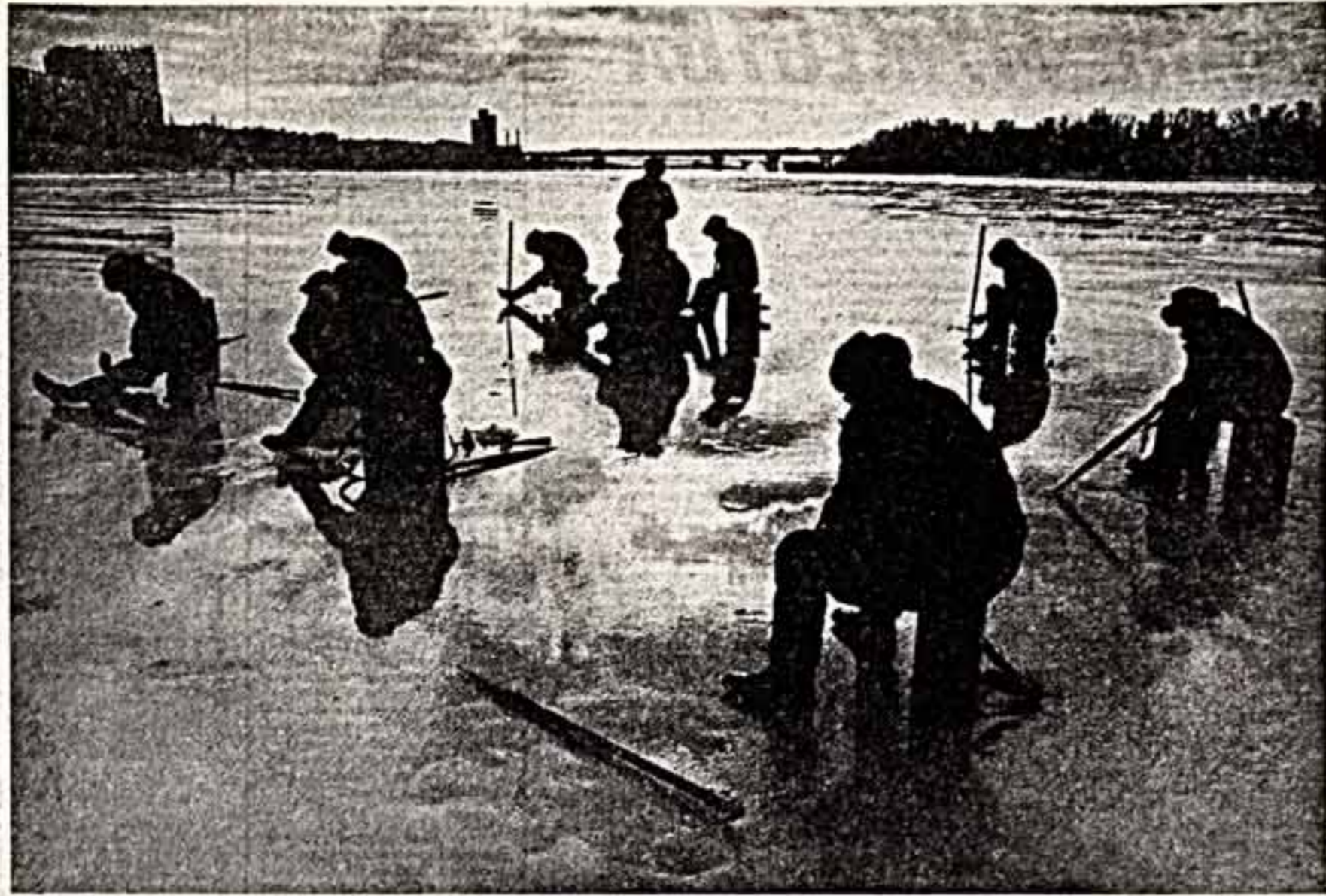
ФОТОКОНКУРС • А. СТЕПАНОВ. «По верному пути».