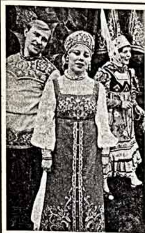
Русская народная весня в танце стали...