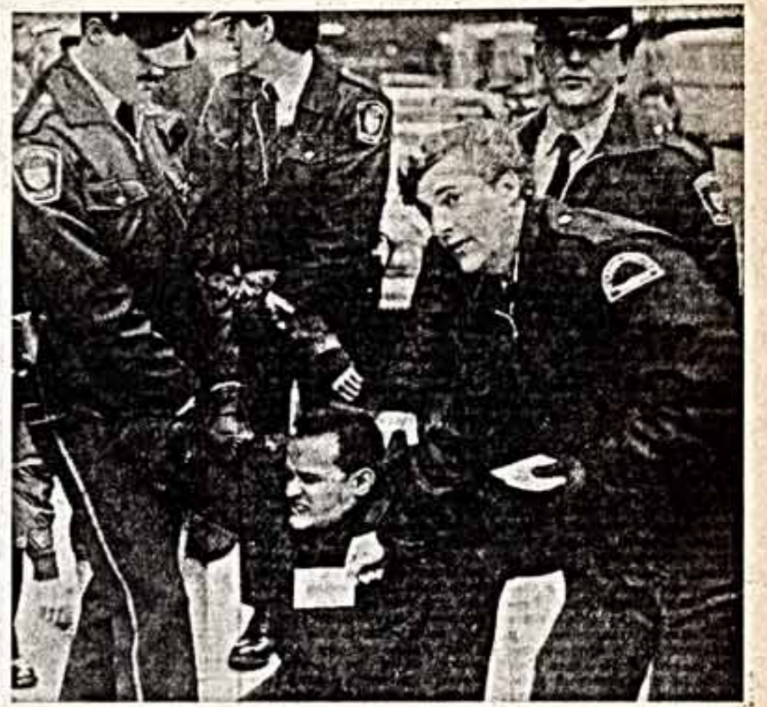
КАНАДА ПАХНЕТ... ДУБИНКАМИ Канада — одно из крупнейших по территории капиталистических государств, страна с хорошо развитой экономикой и достаточно высоким уровнем жизни. Двадцать пять лет назад, помню, им зачитывались книги под названием «Канада, пахнущая смолой», где рассказывалось о беднейших просторах, о шующих лесах, о великих озерах, о людях — аборигенах и пришельцах — сиволох станах. Затем в газетах размещались заголовки статей «Канада, пахнущая бензином», в которых говорилось не о красоте и богатстве этой земли, а о том, как ее природные ресурсы становятся добычей иностранного капитала в конечном счете — в пользу власти Огавы на состоявшейся в канадской столице манифестации протеста. Теперь старый заголовок можно перефразировать так: «Канада, пахнущая полицейскими дубинками». Арист участника демонстрации в Оттаве.