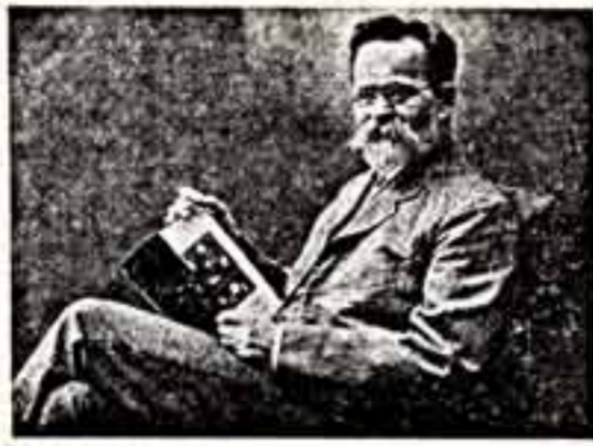
Вышедший из «дворянской тюрьмы» — сын богатого и образованного помещика, женившегося на крепостной крестьянке, Морозов еще в гимназии проявил не только яркие способности в научной деятельности, но и свой богатый и образованный характер.

Он родился 132 года назад, умер 40 лет назад, все в июле месяце. Из 92 лет своей жизни около 30 провел в царских тюрьмах, а 25 из них в самых страшных: сначала Александровский рваелин Петропавловской крепости, куда в свое время заточили декабристов, затем в «дворянской тюрьме» Шлиссельбургской крепости, куда Александр III заключал своих «львиных врагов». Последнее и выпустить оттуда можно было лишь по его личному указу. Недаром Шлиссельбург называли «астрономическим местом смерти». Своим личным врагом — самодержцем посчитал и двадцатилетнего Николая Морозова. Впрочем, имел к тому все основания.