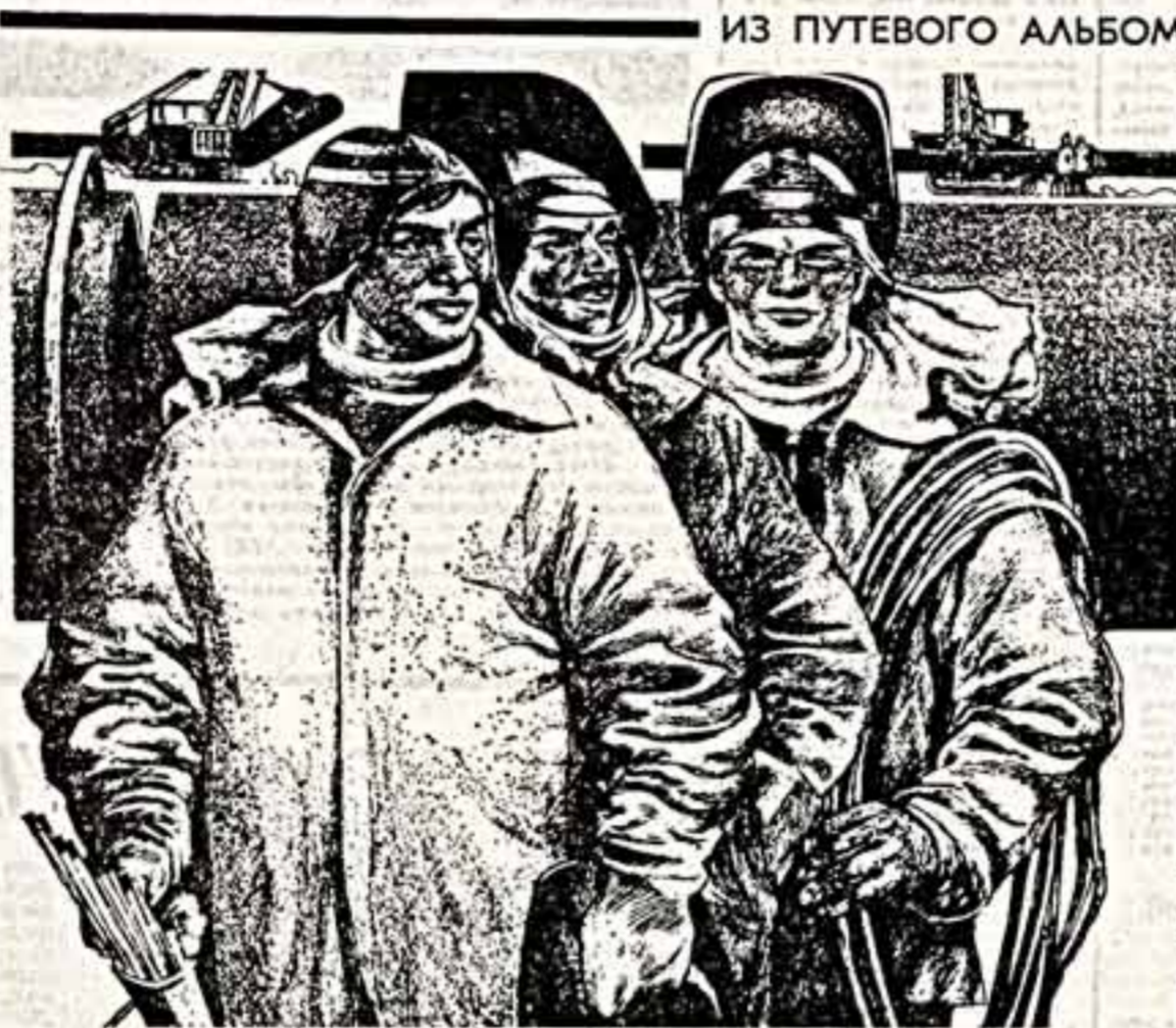
Помощь и забота со стороны — любимые заботы художника и журналиста из Куйбышев. Авторства премия Союза журналистов СССР И. Дубровина. Карандашные наброски (своеобразный художественный диалог) затем в мастерской обработал композитор.

Забота о ветеранах, создание необходимых условий для плодотворного послепенного труда, насыщенной духовной жизни — одно из главных направлений деятельности партийных комитетов в условиях перестройки.