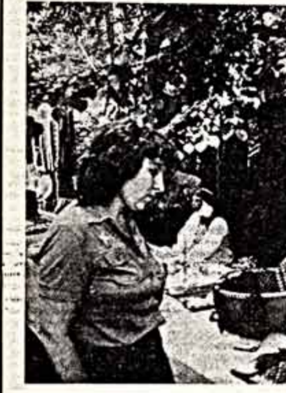
Известная ткачиха из села...