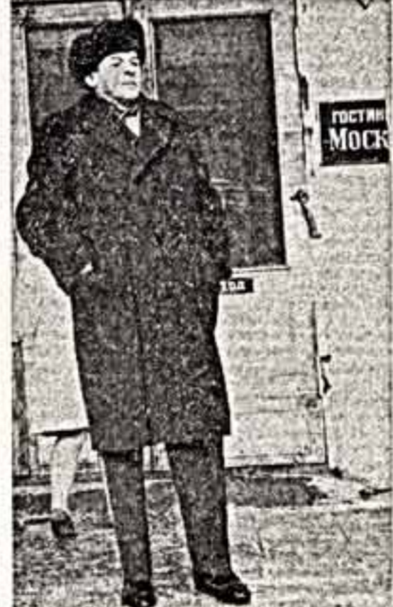
Н. Черкасов в саду Горького.