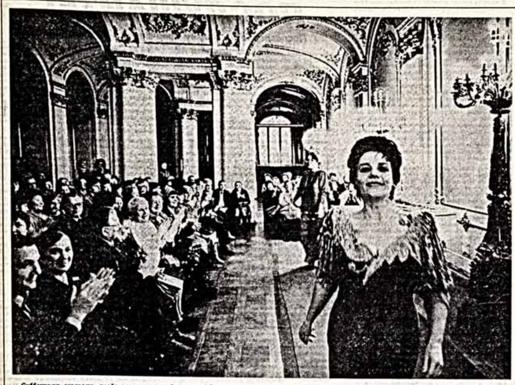
Субботним вечером, когда зажигают музейные залы Екатерининского дворца города Пушкина, в Стасовском зале звучит старинная музыка.