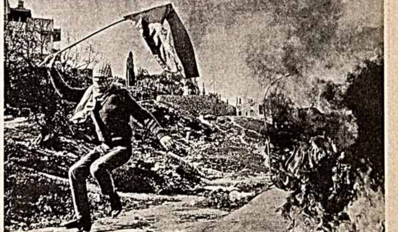
Среди арабского населения проводится полевые аресты. Особенно широко масштабы операцию захватили провали в районе Найбуса...