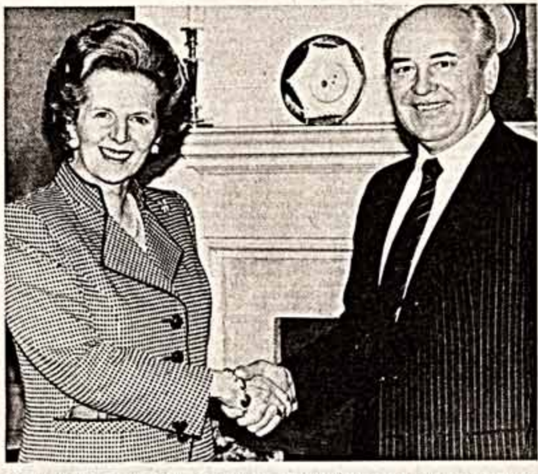
Лондон. На Даунинг-стрит, 10 состоялась встреча Генерального секретаря ЦК КПСС...