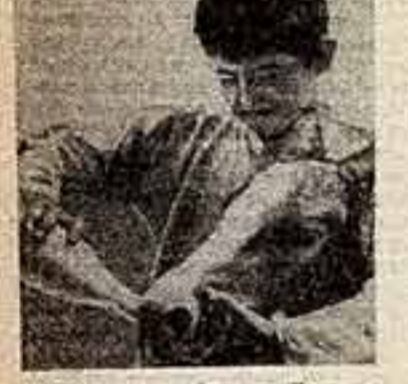
Кадр из кинофильма «Круг».