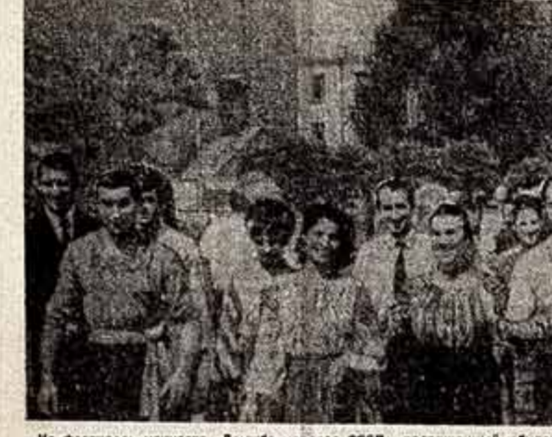
На фестивале искусств «Дружба народов СССР», посвященный юбилею Великого Октября, прибыли представители советского многонационального искусства. Среди них прославленные коллективы и известные всей страны исполнители. Участники Фестиваля в Кишиневе.

НАШ СПЕЦИАЛЬНЫЙ КОРРЕСПОНДЕНТ КИМ ЛЯСКО ПЕРЕДАЕТ ИЗ КИШИНЕВА