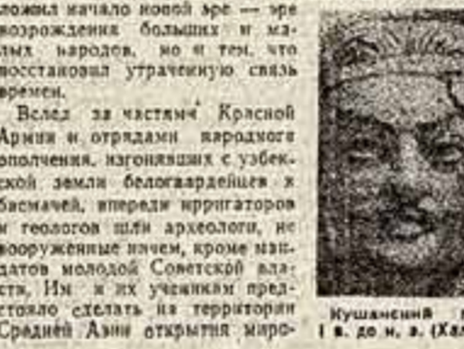
Ишумедовский принцип. В до м. з. (Халхалие).

Сейчас к уже облетевшему весь мир мифу древнего городища Афаркада, где были обнаружены великолепные фрески, прибавилось новое — Халхалие.