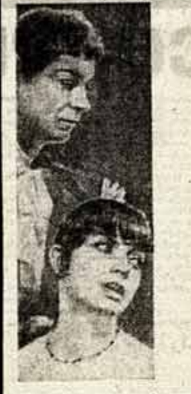
21 октября постановкой пьесы «Марчана Пинья» испанского поэта и драматурга Федерико Гарсиа Лорды открылся новый сезон в Красноярском театре имени Жерара Филипа...