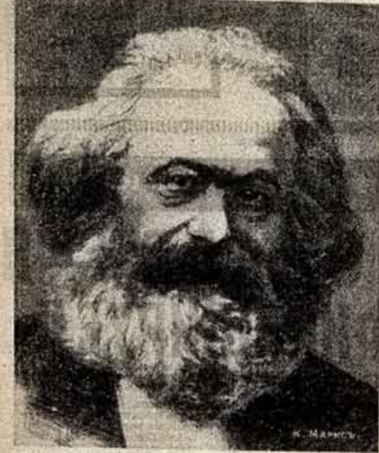
К. Маркс. Офорт А. Платигорского. Изд. в Петербурге, 1906 г.