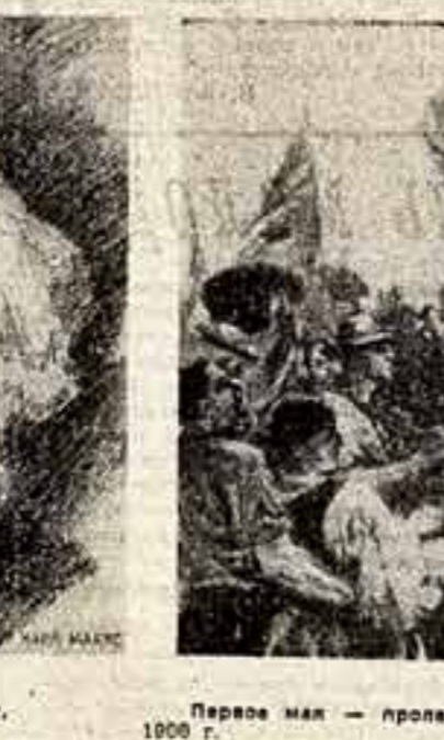
Первое мая — Пролетарский праздник. Рисунок Г. Нентша (Германия). Изд. в Петербурге, 1906 г.