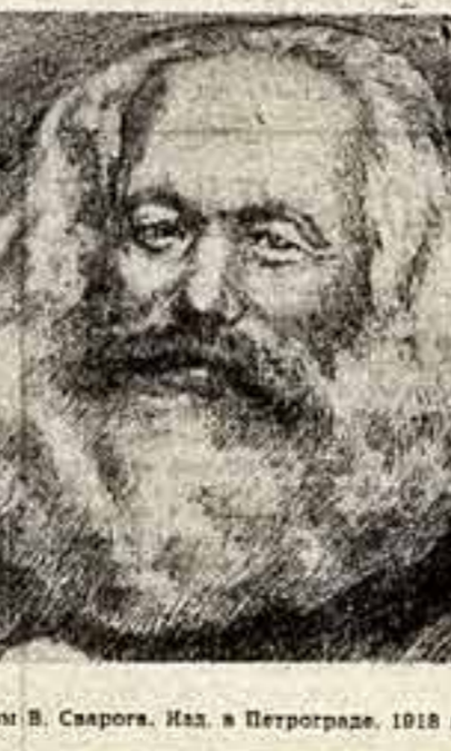
Карл Маркс. Рисунок пером В. Свиригова. Изд. в Петрограде, 1918 г.

Мировое искусство и эстетика выступают у Маркса как верный и могущественный союзник, значительно усиливший силу его собственного эстетического строя и позволивший читателю «Капитала» взглянуть на истинную природу капитализма и его историческую сущность. Вместе с тем способность искусства верно запечатлеть важнейшие социально-экономические процессы, раскрывать их человеческое содержание, является для Маркса полновесным эстетическим критерием, позволяющим определить истинную культурную ценность того или иного автора и его произведения.