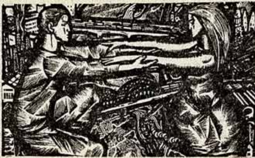
Г. Кроллс. «Мости». (Из цикла «Мои Риги»).