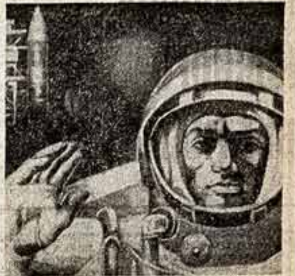
А. Голтинов. «Шестидесят первый». (Из серии «Мои истории»).

Искусство — это биография народа — такими словами начинается вводная статья в одном из буклетов-каталогов республиканской юбилейной выставки изобразительных искусств в Риге.