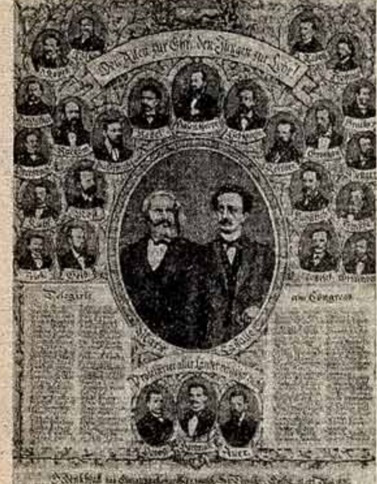
Памятный листок Готского конгресса германской социал-демократии. Изд. в Мюнхене (Германия), конец XIX — начало XX в.