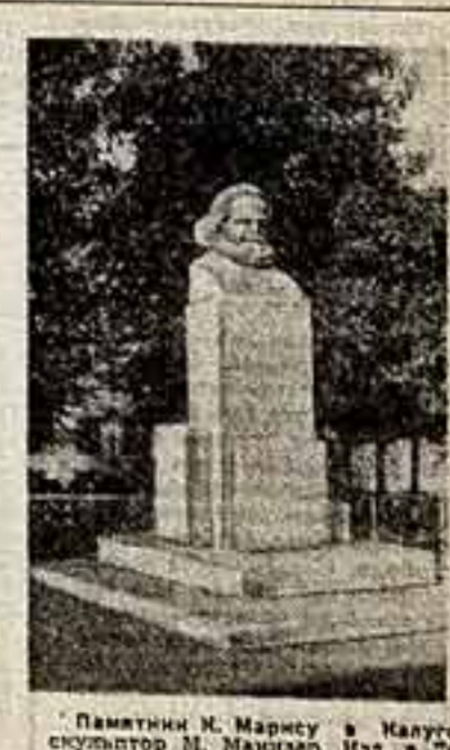
Памятник К. Марксу в Мануэре, скульптор М. Манзеров. Изд. в Ленинграде, конец 20-х годов.