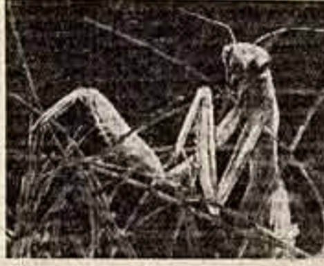
Кадр из фильма «Как уминаются насекомые».

Недавно московские кинолюбители побывали в Ленинграде с ответным визитом, показали им свои лучшие фильмы.