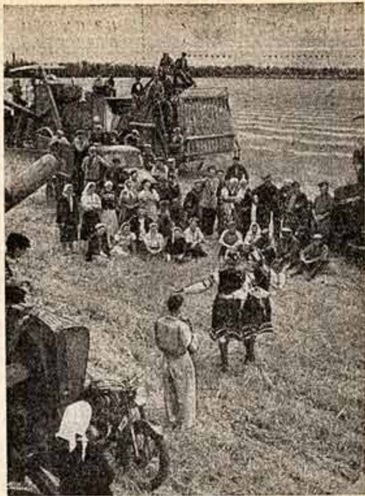
Краснодарский край. Артистично-художественная бригада колхоза имени Калинина Тимашевского района пользуется большой популярностью среди труженников артели. Сейчас бригада ведет большую культурно-просветительную работу среди колхозников, занятых на уборке урожая хлеба. На полях выступают чтецы, певцы, танцоры. Кроме того, члены агитбригады выпускают листовки и стенные газеты, доставляют механизаторам свежие книги, газеты и журналы. На снимке: выступление танцоров агитбригады колхоза имени Калинина в поле во время обдогоно-го периода.

Секретарь Президиума Верховного Совета СССР М. ГЕОРГАДЗЕ.