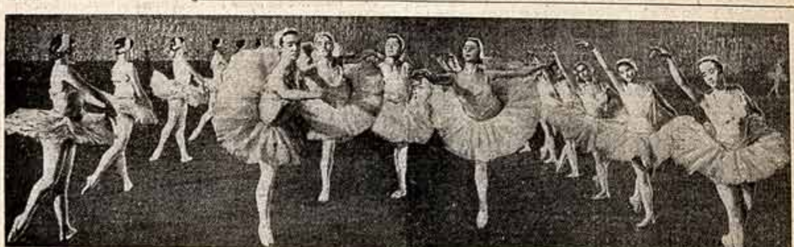
Праздник танца в Риге. Выступление солистки Ленинградского академического театра оперы и балета им. С. М. Кирова, сцена на балете П. И. Чайковского «Лебединое озеро».