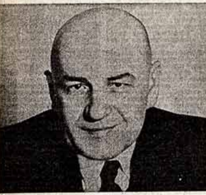
Борис Васильевич Щукин — художник огромного, неисчерпаемого таланта, тонкой интуиции, обладал осязанием даром перевоплощения. Всем своим существом, всеми членами и мечтами, без остатка он принадлежал сложному искусству сцены. Казалось, для Бориса Васильевича не было ничего недостижного, неразгаданного в мире творческих исканий. На вопрос, какой инстинкт он считал перед приходом в театр, Борис Васильевич отвечал просто — школу жизни. Создателем фронтонов, он встал первой мировой войны после слесаря-лекальщика, потом помощником паровозного машиниста. Сценическую жизнь начал в художественной самодеятельности железнодорожного депо. Замечательный Е. Вахтанговым, Щукин был приглашен в студию и быстро выдвинулся на первые роли. В восторженных восторгах и восторгах Е. Вахтангова и Б. Щукина было много об-

улице». Биологическую трагедию смерти Щукин превратил в трагедию социальную. Триумфальный успех В. Щукина в роли Булычова объясняется тем, что он взглянул на своего героя глазами современника с высоты делений и свершения людей нашего времени. Вот почему созданный им образ при всем трагизме получил оптимистическое звучание, поднялся при всей своей простоте до высокой патетики, обрел могучую силу художественного, философского и социального обобщения. Настоящим подвигом художника явилось воплощение Щукиным образа В. И. Ленина на сцене и в кино. В 1923 году Щукин присутствовал в Кремле на представлении пьесы «Июль самодержавия» поставленной самодельными войсками в кинофильме «Принцесса Туралют» и обреченный на смерть командир Мальмо — «Даленое» А. Афиногенова, маленький