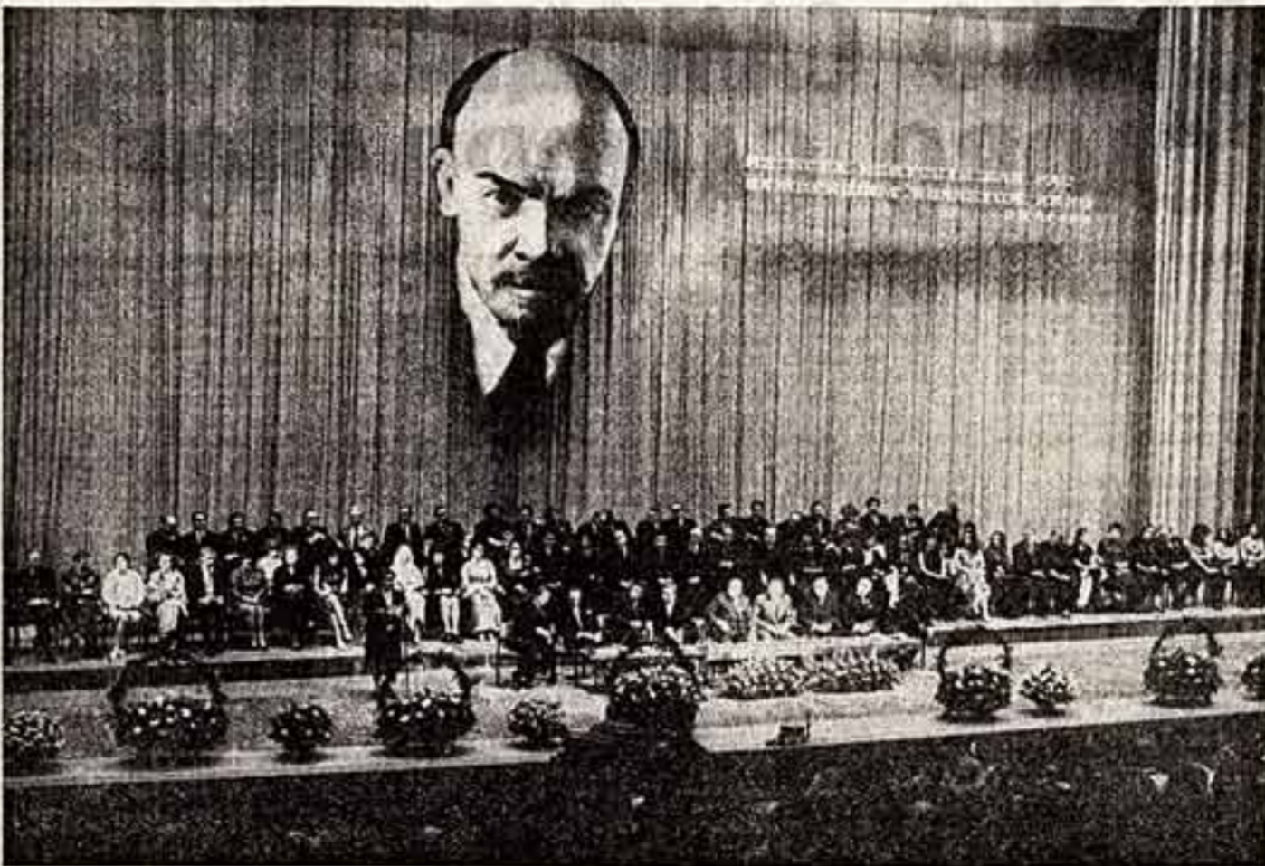
Вчера, 15 апреля, участники фестиваля были приняты в ЦК КП Азербайджана. С большой речью перед ними выступил первый секретарь ЦК КП Азербайджана тов. Г. А. Алиев...