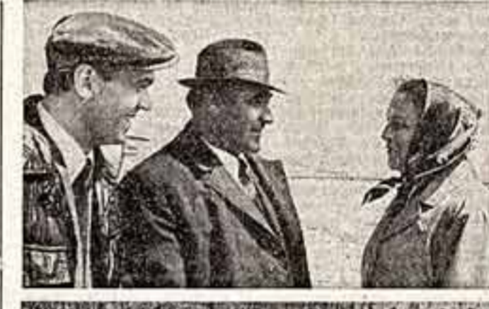
Вчера, 15 апреля, участники фестиваля были приняты в ЦК КП Азербайджана. С большой речью перед ними выступил первый секретарь ЦК КП Азербайджана тов. Г. А. Алиев...