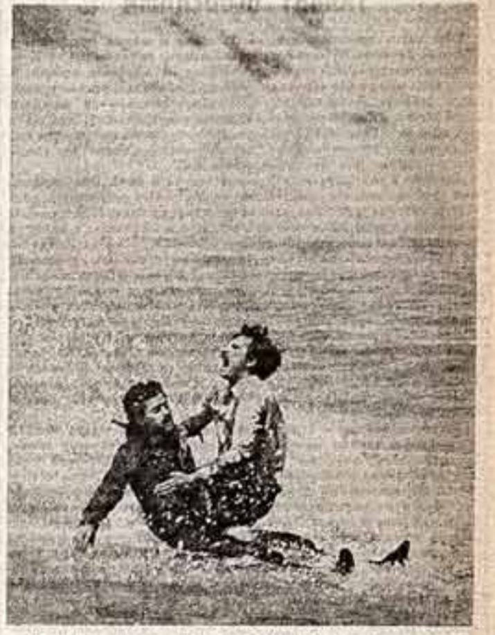
«Ветреное море» — новая совместная постановка советских и чехословацких кинематографистов. Фильм рассказывает о блоке гавани Советской армии в Закарпатье и об участии чехских интернационалистов в борьбе Красной Армии за освобождение Астрахани и Валу от белоохранцев.