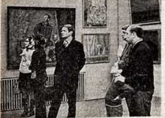
В Москве на Кузнецком мосту открыта Весенняя выставка работ московских художников.