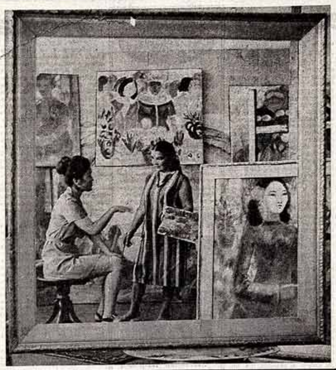
Айша Галимбаева.

Айша Галимбаева — народная художница Казахстана — первая казахская художница. Участник многих международных выставок, она интересуется проблемами искусства, во всем жанрах живописи.