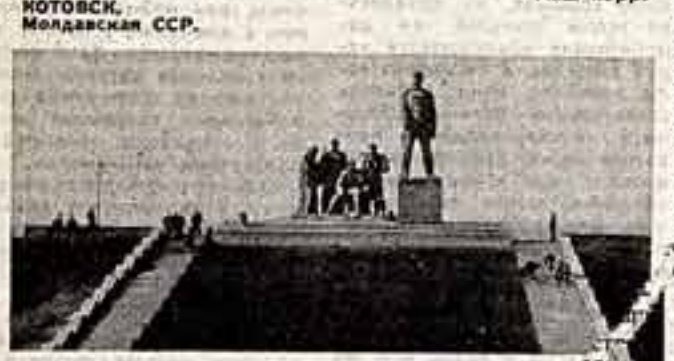
КОТОВСК, Молдавская ССР. Наш корр.

В городе Котовске Молдавской ССР в канун праздника Октября состоялось открытие памятника прославленному герою гражданской войны Григорию Котовскому.