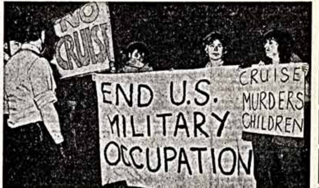
Участники антивоенной демонстрации в Берлине.