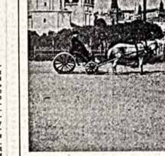
ПО ВАШЕЙ ПРОСЬБЕ

Лишь в том случае, когда реконструкция, дело это, безусловно, нужное, а в условиях растущего многонаселенного города и просто необходимая, но сколько осторожности, такта и профессионального мастерства требует оно от проектировщиков! Люди, решающие судьбу крупного города, обязаны смотреть