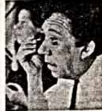
— Директором труднее. Вот учу новые слова аттракциона, кинотеатра, коммуналки... Сметается! Вот в строки свисают, когда в пятах ускорить сооружение нового цирка, который должен вырасти на месте старого. Что ж, тут ничего не поделаешь. Сметается! Идет с Юрием Михайловичем. Правда, в своей книге «Почти серьезно...» он признался, что порой ему снится страшный сон: артист работает в цирке, а его полно зрителей, а он сидит в кресле, а никто не смеется. Но ведь это только сон. А на самом деле над его репрезентацией смеются всегда. Уверен: сегодняшняя награда никакой раз подтвердит это.