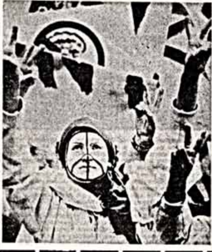
Участники антивоенной демонстрации в Берлине. Прогрессивная общественность Великобритании выступила против вооруженных сил США на Британских островах...