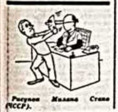
Рисунки Мадона Стела (СССР).