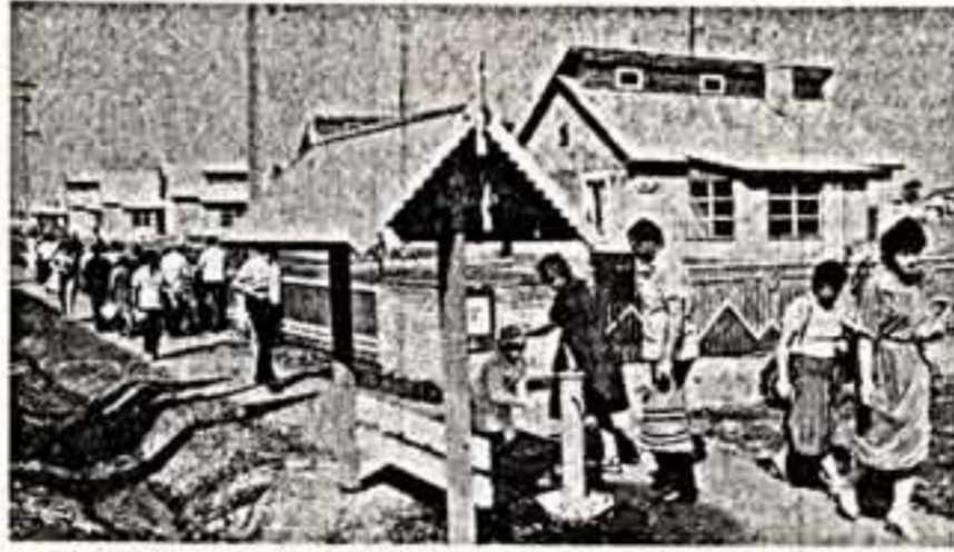
В Киевской области завершается строительство жилья для колхозников, закупоренных из района Чернобыльской АЭС. Строители Украины передали под заселение около 3.500 домов со всеми удобствами и необходимыми хозяйственными постройками. В последние дни августа справили новоселья тысячи возлюбленных и их семей. 310 углубов в селе Берестки построили крымчане, 150 — села Набрата — киевляне, 350 — в селах Марьяловна и Королезна — лвовляне.