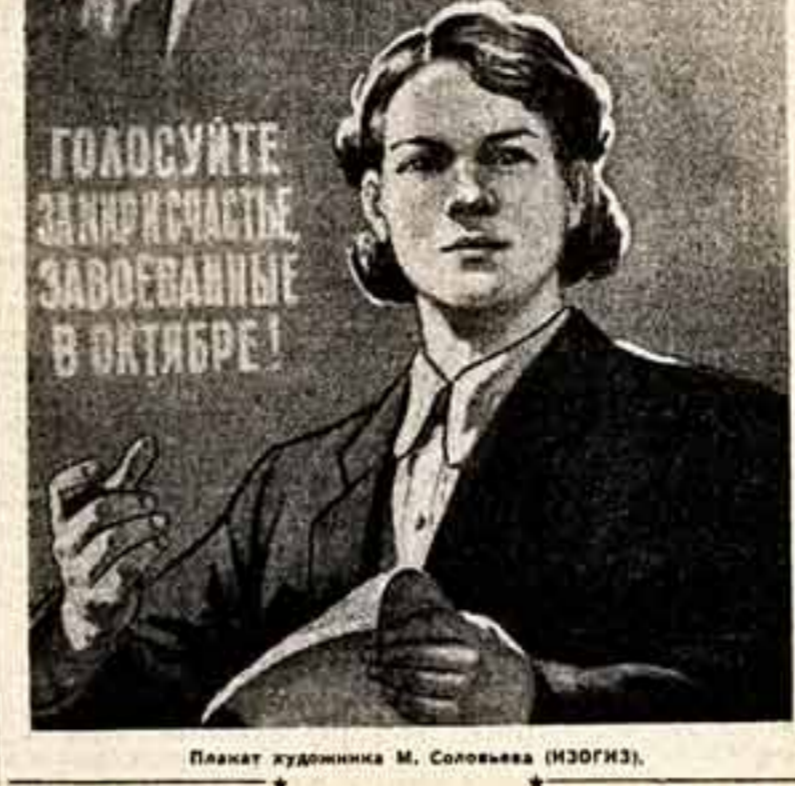
Плакат художника М. Соловьева (ИЗОГИЗ).

ВСЯ ВЛАСТЬ В СССР ПРИНАДЛЕЖИТ ТРУДЯЩИМСЯ ГОРОДАМ И ДЕРЕВНЯМ В ЛИЦЕ СОВЕТОВ ДЕПУТАТОВ ТРУДЯЩИХСЯ