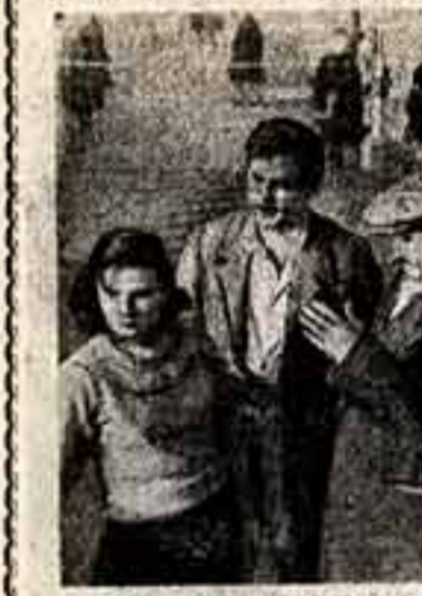
В Тбилиси, на мнестудии «Грузин-фильм» идут съемки нового фильма «Имачех» (сценарий Р. Дзигурдзе и Т. Абуладзе, постановка режиссера Т. Абуладзе, оператор Л. Пасташиани).

гов, произведения авторов братских республик, песни зарубежных писателей.